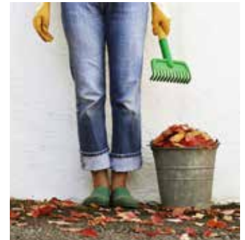
DE ROTTERDAMSE OPEN VOLKSTUINDAGEN

Toch waren er nog enkele stoere doorzetters bestaande uit 2 à 3 groepjes kinderen met hun ouders die de tocht volbrachten, waarbij de kinderen als beloning een ijsje kregen. Voor de rest ging het feest niet door. Zo had de Kweekkas zich terug getrokken en gingen ook de overige kinderactiviteiten niet door. Wel hadden sommige tuinen wat bezoekers van buitenaf. Volgend jaar beter.