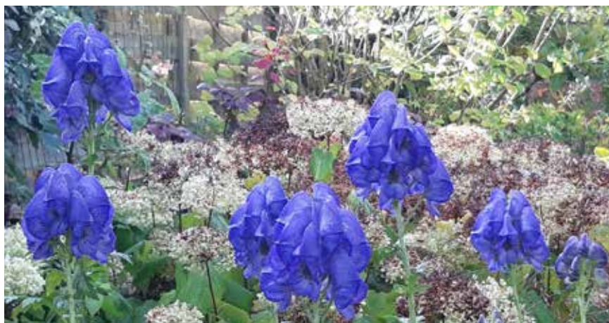
Eind oktober... Hoe mooi kleuren deze laatbloeiers.