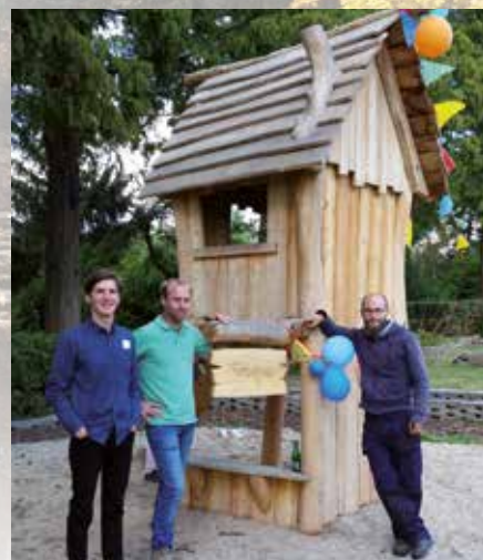
Het ontwerpteam van de natuurspeeltuin die mede dankzij een gift van de Gebiedscommissie werd gerealiseerd.

Kijk voor uitgebreide informatie op www.vtvlusthof.nl