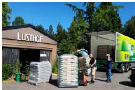
Het bevoorraden van de loods waar tuinleden allerlei tuinproducten kunnen kopen.

op het complex aanwezige kweekkas-project, waar van alles te leren valt over wat groeit en bloeit tot en met het zelf composteren toe. Bovendien werd dankzij een gift van de gebiedscommissie bij het 60-jarig jubileum een zelfontworpen natuurspeeltuin aangelegd, waarvan druk gebruik wordt gemaakt. In het midden daarvan werd een door diezelfde gebiedscommissie geschonken Amberboom geplant.