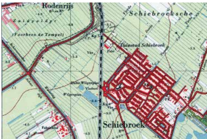
Kaarten van Schiebroek omstreeks 1962 en 1968

Daarmee was de basis voor VTV Lusthof gelegd. De eerste jaren werd er met 84 deelnemers getuind op ca. 1,5 ha. toegewezen grond langs de Ringdijk ter hoogte van