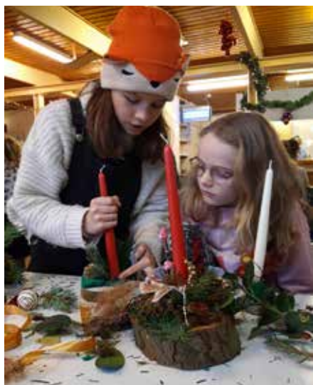
Het maken van Kerststukjes op een gezellige wintermiddag in het clubhuis van VTV Lusthof

Het is goed om te zien dat veel jonge mensen en gezinnen met kinderen het tuinieren hebben ontdekt.